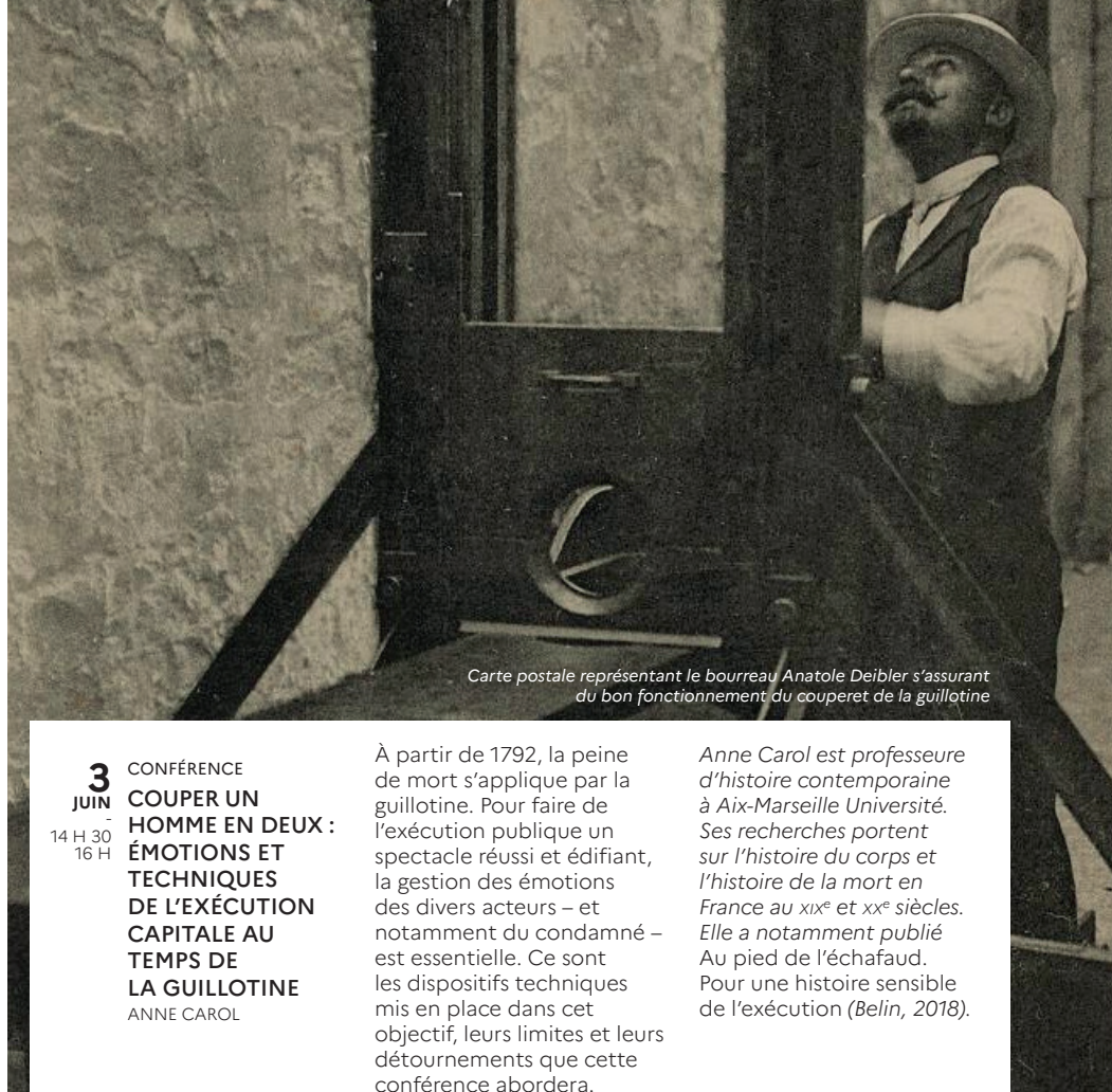
Carte postale représentant le bourreau Anatole Deibler s'assurant du bon fonctionnement du couperet de la guillotine

3 CONFÉRENCE JUIN 14 H 30 - 16 H COUPER UN HOMME EN DEUX : ÉMOTIONS ET TECHNIQUES DE L'EXÉCUTION CAPITALE AU TEMPS DE LA GUILLOTINE ANNE CAROL